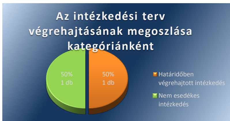
2. számú ábra

A végrehajtott intézkedések kategóriánkénti bemutatását a 2. számú ábra szemlélteti.